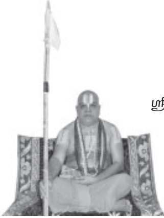
50வது பட்டத்தை அலங்கரிக்கும் ஜீயர் ஸ்வாமி