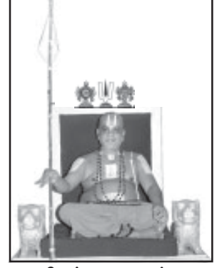
ஸ்ரீமத் பரமஹம்ஸ ரங்கராமானுஜ ஜீயர் (எம்பெருமானார் ஜீயர்) 41வது பட்டம்