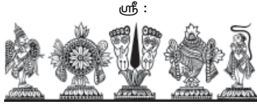
ஸ்ரீமதே ராமாநுஜாய நம: