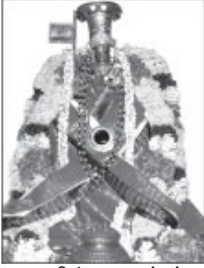
பவிஷ்யதாசார்யர் (எம்பெருமானார்) ஆழ்வார் திருநகரி